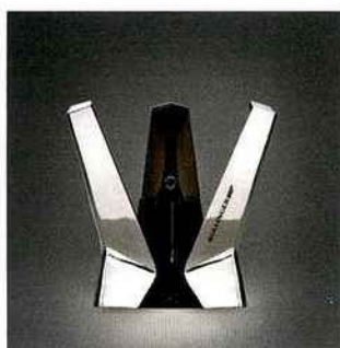
CHAMPAGNE BOLLINGER Bollinger Tribute to Moonraker Luxury Limited Edition A La Cavavin • Lorient et à La Cave De Bellevue • Larmor-Plage