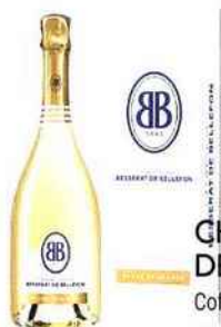
CHAMPAGNE BESSERAT DE BELFON Coffret Blanc de Blancs A La Cavavin • Lorient