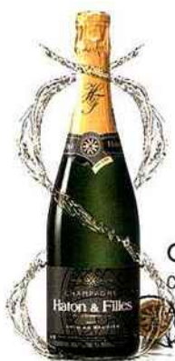
CHAMPAGNE HATON Cuvée Carte Blanche A La Cavavin • Lorient et à La Cave De Bellevue • Larmor-Plage