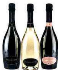
CHAMPAGNE CHARLES LEGEND Quatrième cuvée, un champagne "brut nature"