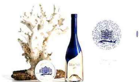
CHAMPAGNE DE SAINT GALL Le Charpenté