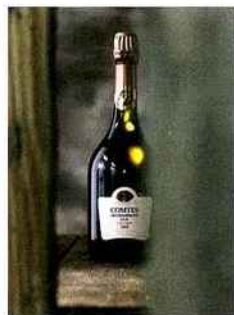
CHAMPAGNE TAITTINGER Comtes de Champagne Rosé Cuvée 2007 A La Cavavin • Lorient