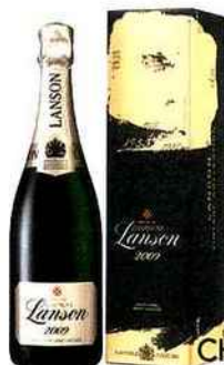
CHAMPAGNE LANSON Gold Label millésime 2009